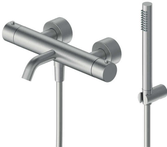
IMMAGINE PRODOTTO / PRODUCT IMAGE