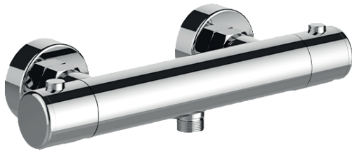
IMMAGINE PRODOTTO / PRODUCT IMAGE