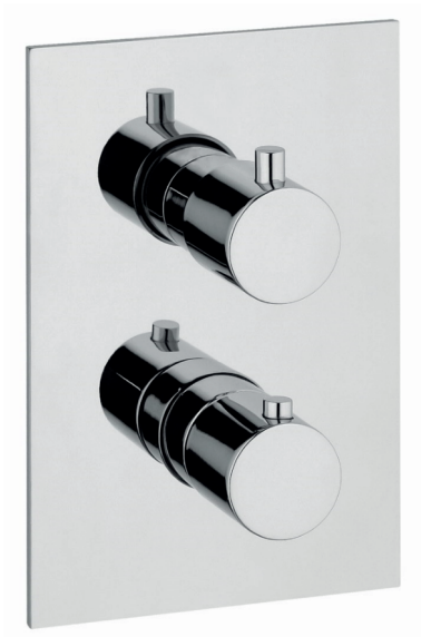
IMMAGINE PRODOTTO / PRODUCT IMAGE