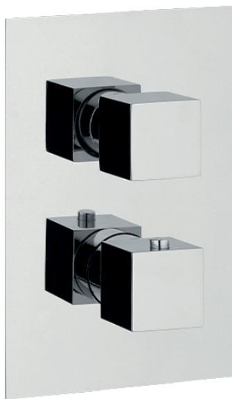
IMMAGINE PRODOTTO / PRODUCT IMAGE